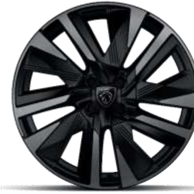
Jantes alliage 18" diamantées EVISSA bi-tons Noir Onyx, vernis Black Mist avec inserts Noir Onyx mat

De série sur ALLURE, GT En option sur BUSINESS (Pneumatiques All Seasons inclus)