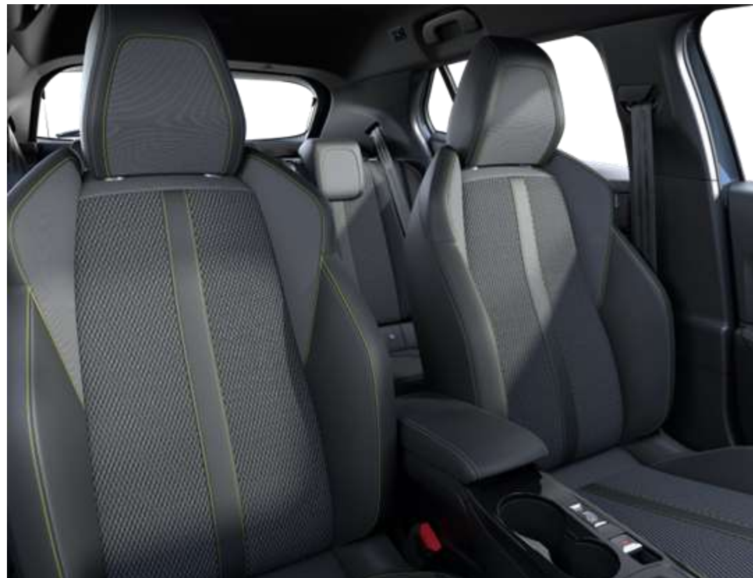
Sellerie tissu BELOMKA, accompagnement TEP Isabella, trimatière Uni Capy et surpiqûres Vert Adamite