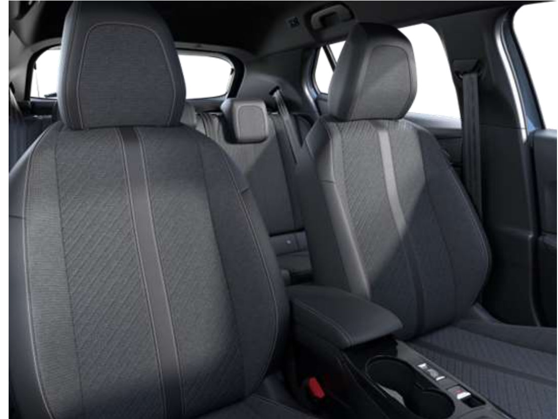
Sellerie tissu CASUAL LOMSA embossé, accompagnement TEP Isabella, tri-matière LOMSA et surpiqûres Quartz