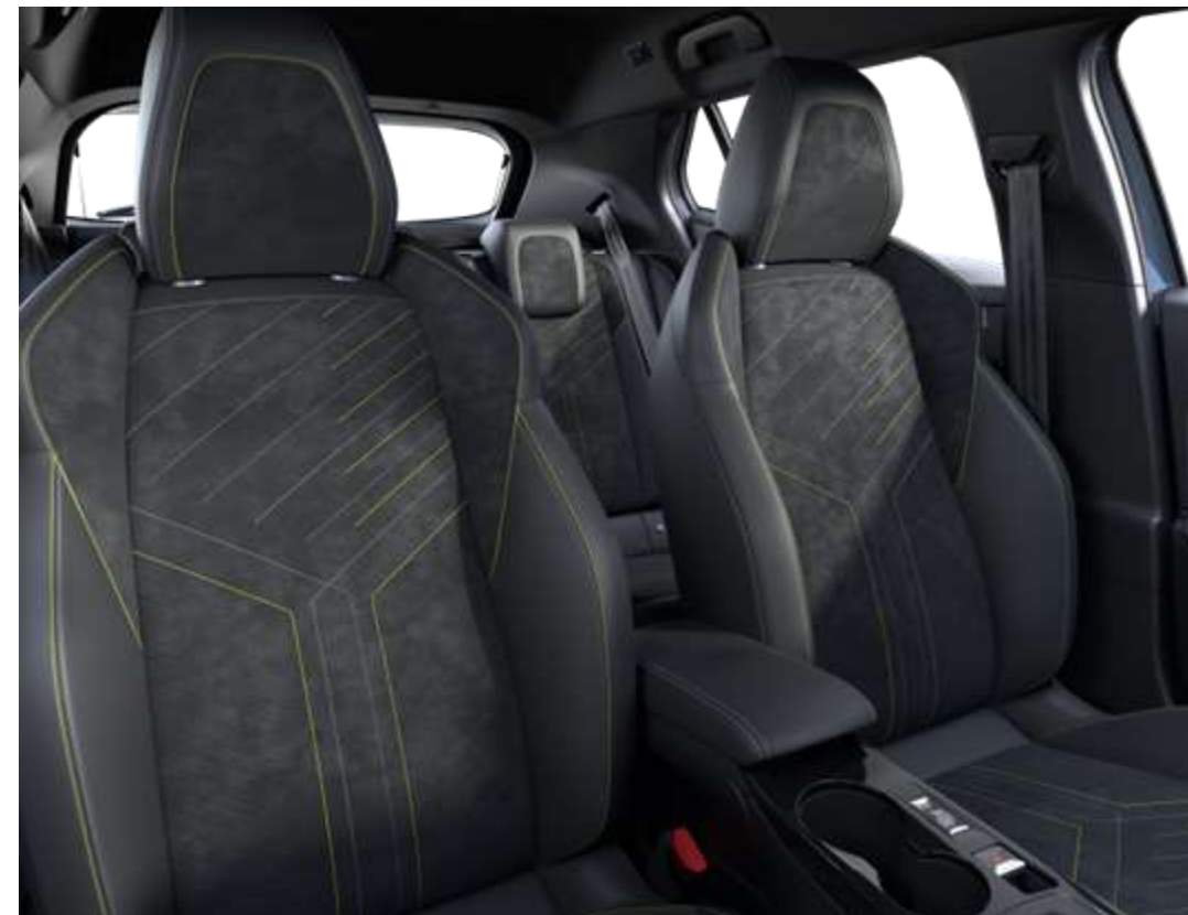
Sellerie Alcantara® Mistral ICONIUM accompagnement TEP Isabella, trimatière Alcantara Noir et surpiqûres Vert Adamite