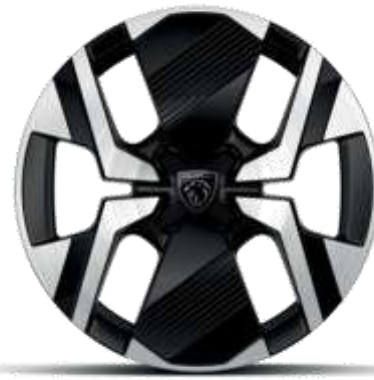
Jantes alliage 17" diamantées KARAKOY bi-tons Noir Onyx et vernis brillant

De série sur ALLURE, GT En option sur BUSINESS (Pneumatiques All Seasons inclus)