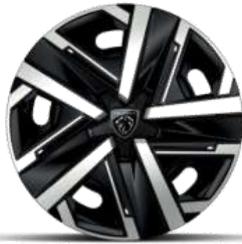
Jantes tôle 16" avec enjoliveurs SILOM Gris Eclat & Noir Orbitat, vernis mat