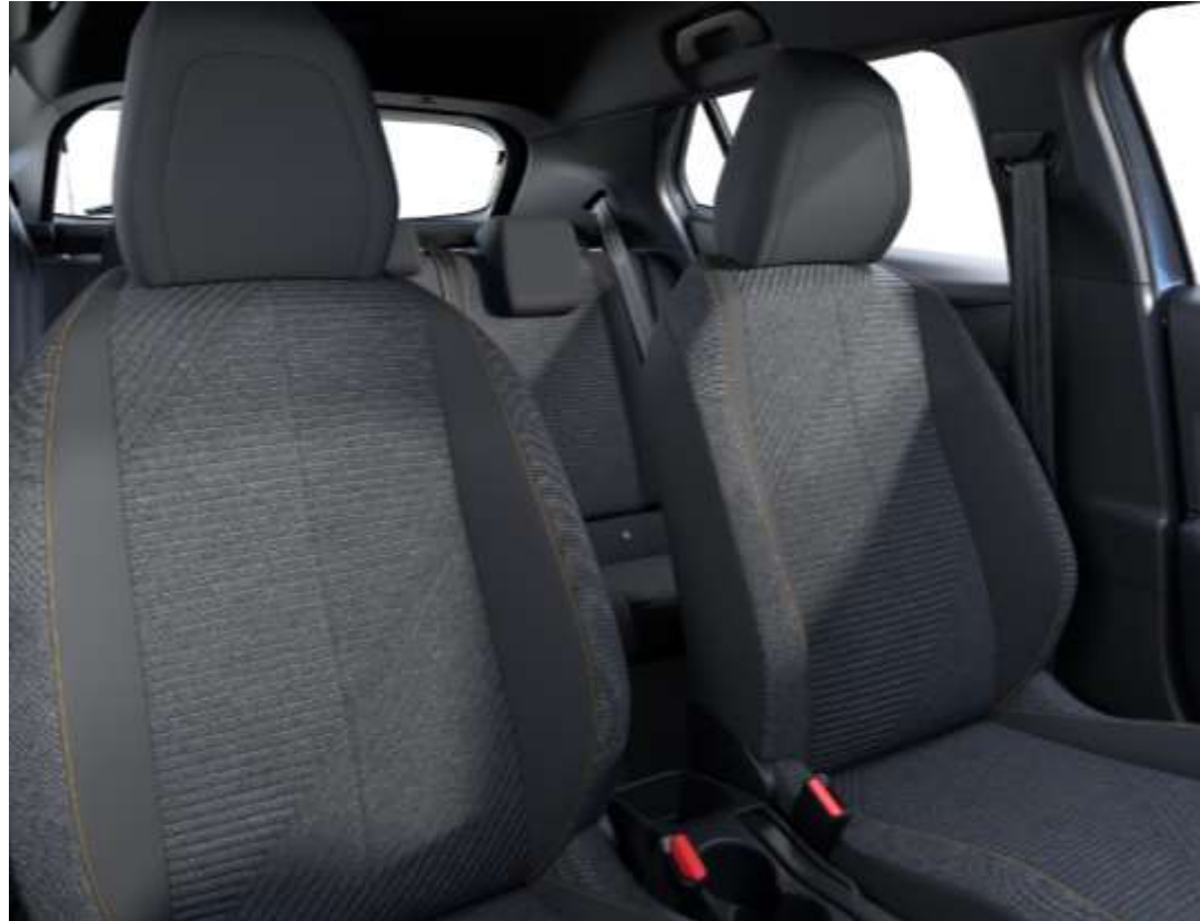
Sellerie tissu RENZO, accompagnement Rimini, surpiqûres Orange Sunrise